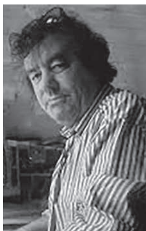
JOHAN SONNEVILLE